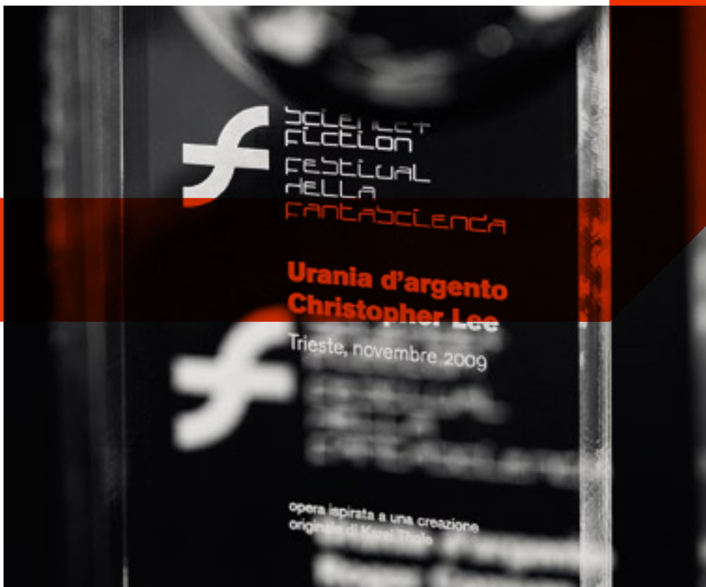
A destra Particolare dell'Urania d'Argento realizzato per Christopher Lee.

Ritiene che il momento più importante della sua carriera sia stato condurre il Saturday night live nel 1978 con John Belushi, Dan Aykroyd, Bill Murray, Gilda Radner, Laraine Newman e Jane Curtin. È ancora il terzo show più apprezzato della serie. Per il suo contributo al cinema Lee ha ricevuto premi negli Stati Uniti, in Francia, Germania, Spagna, Portogallo, Italia, Repubblica Ceca, Croazia e Gran Bretagna ed è Comandante dell'Ordine di San Giovanni di Gerusalemme, l'ordine più antico al mondo. Nel 2001 è stato nominato Commander of the Order of the British Empire e nel 2009 è stato nominato Cavaliere dal Principe Carlo d'Inghilterra.